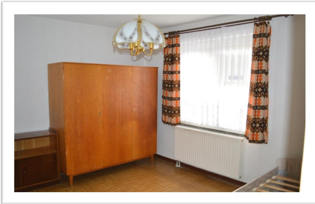
Blick in das Gästezimmer im EG