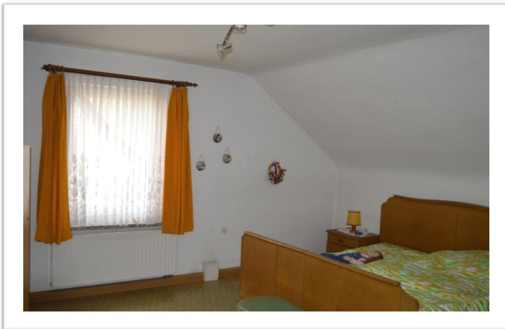
Blick in das Schlafzimmer im OG