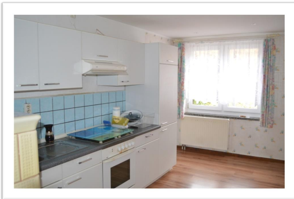
Blick in die Küche im EG