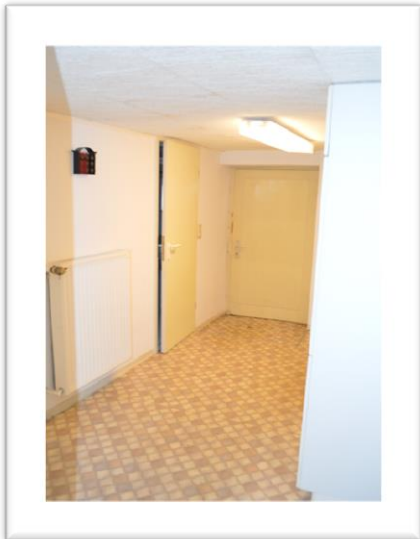
Blick in die kleine Einlieger- wohnung im Kellergeschoß