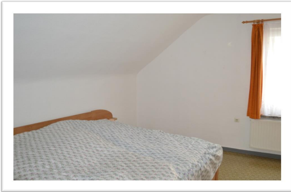
Blick in ein weiteres Zimmer im OG