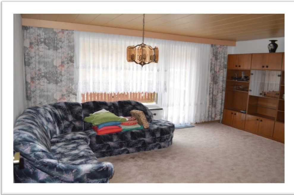
Blick in das Wohnzimmer im EG mit Zugang zum Balkon