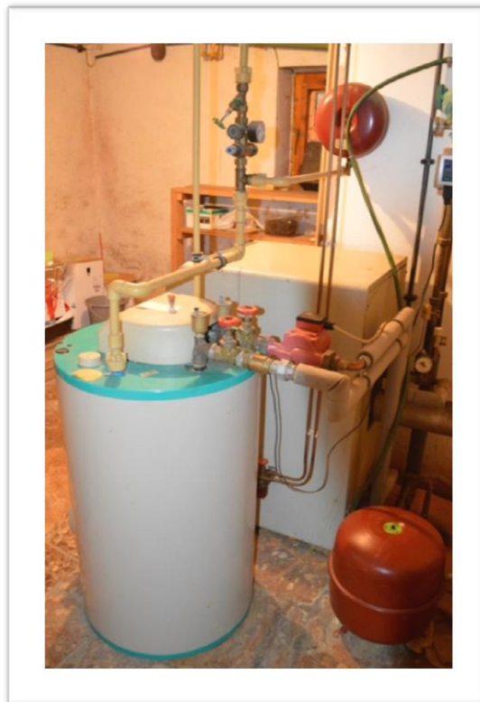
Blick in den Heizraum im KG