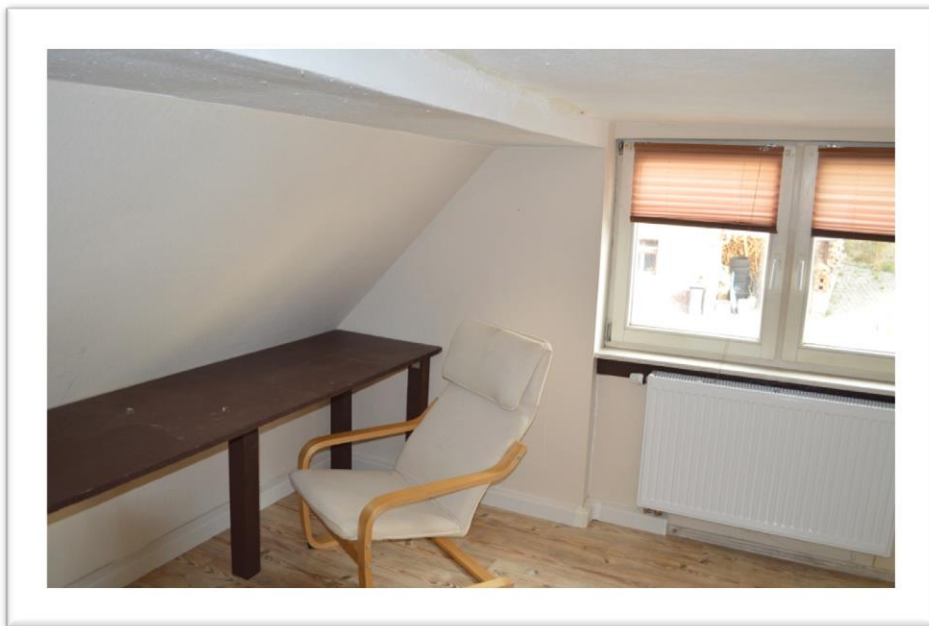
Blick in das Gästezimmer im OG (rechter Bereich)