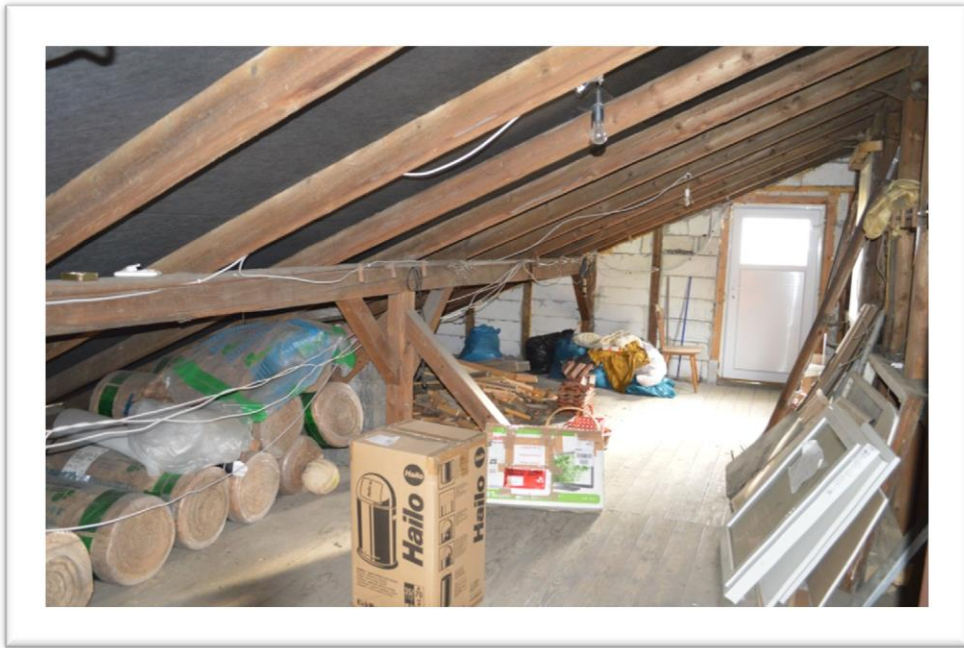
Blick zum Bodenanteil im OG