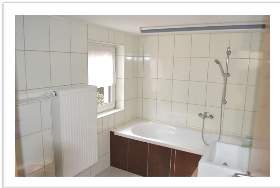
Blick in das Bad im EG