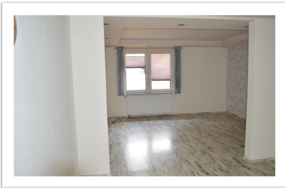
Blick in die offene Küche im EG