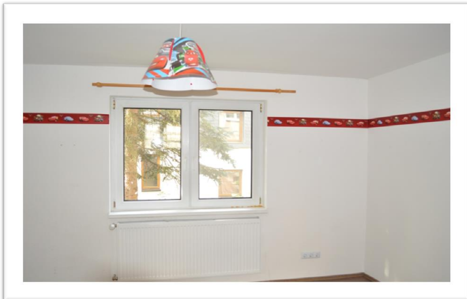
Blick in das Kinderzimmer im EG