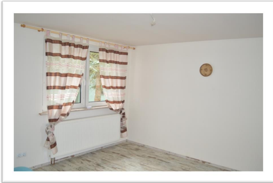
Blick in das Wohnzimmer im EG