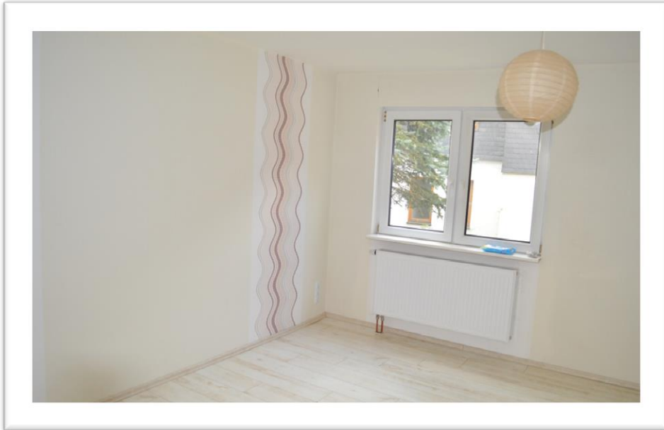
Blick in das Schlafzimmer im EG