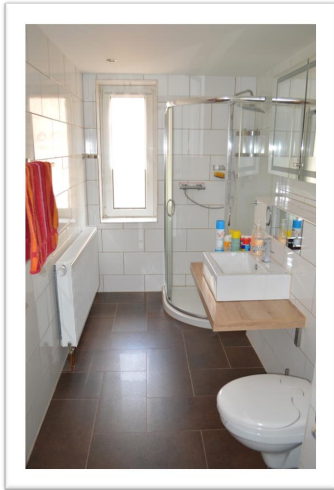
Blick in die Dusche mit WC im EG