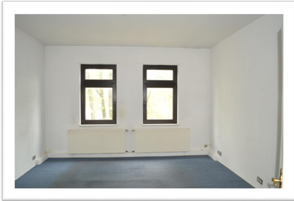
Blick in das Schlafzimmer im OG