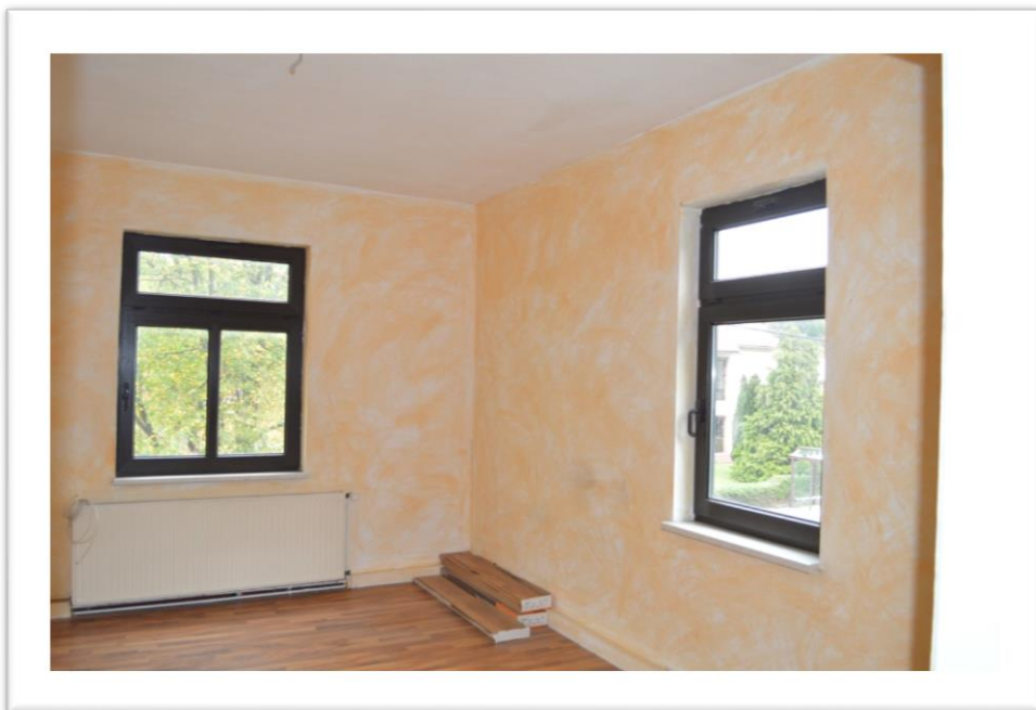
Blick in das Wohnzimmer im OG