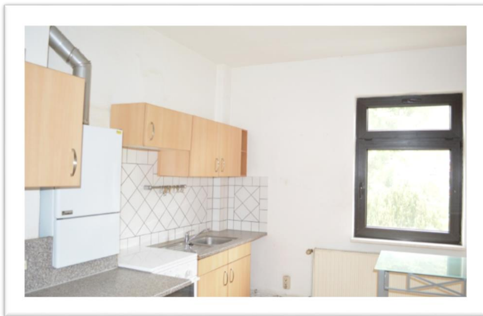
Blick in die Küche im OG