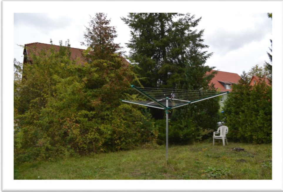
Blick in den Gartenbereich