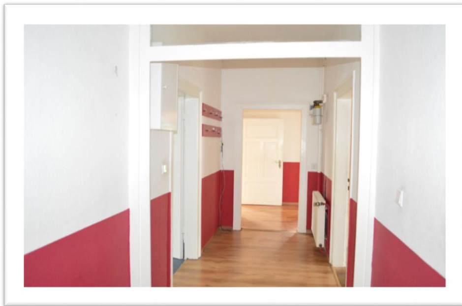
Blick in den Flur im OG