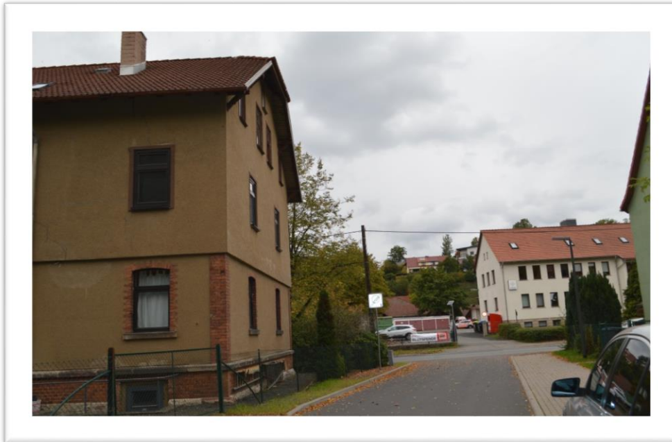
Blick von der Hofausfahrt zur Hauptstraße