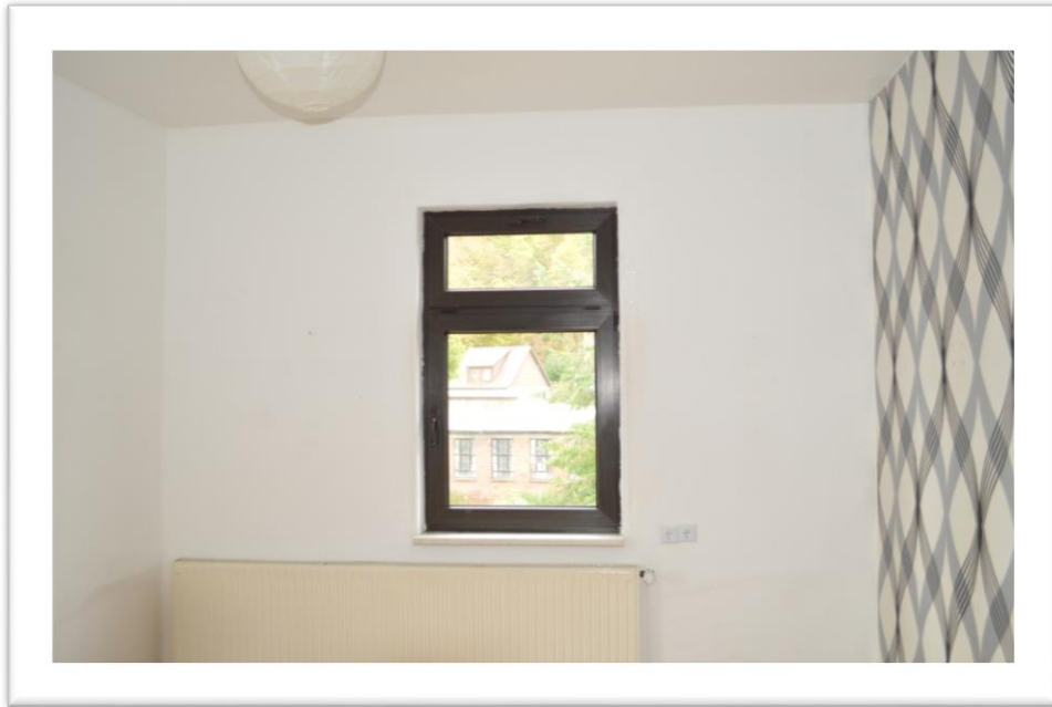
Blick in das Gästezimmer im OG